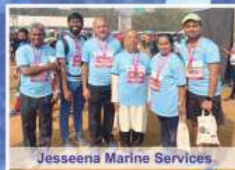
Jesseena Marine Services