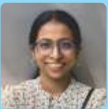
Sweetie Maria Jose St. Bartholomew Church (Kalyan East)

The North Wind boasted of its great strength, but the Sun argued that true power lies in gentleness. “We shall have a contest,” proposed the Sun.