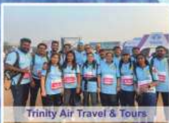
Trinity Air Travel & Tours